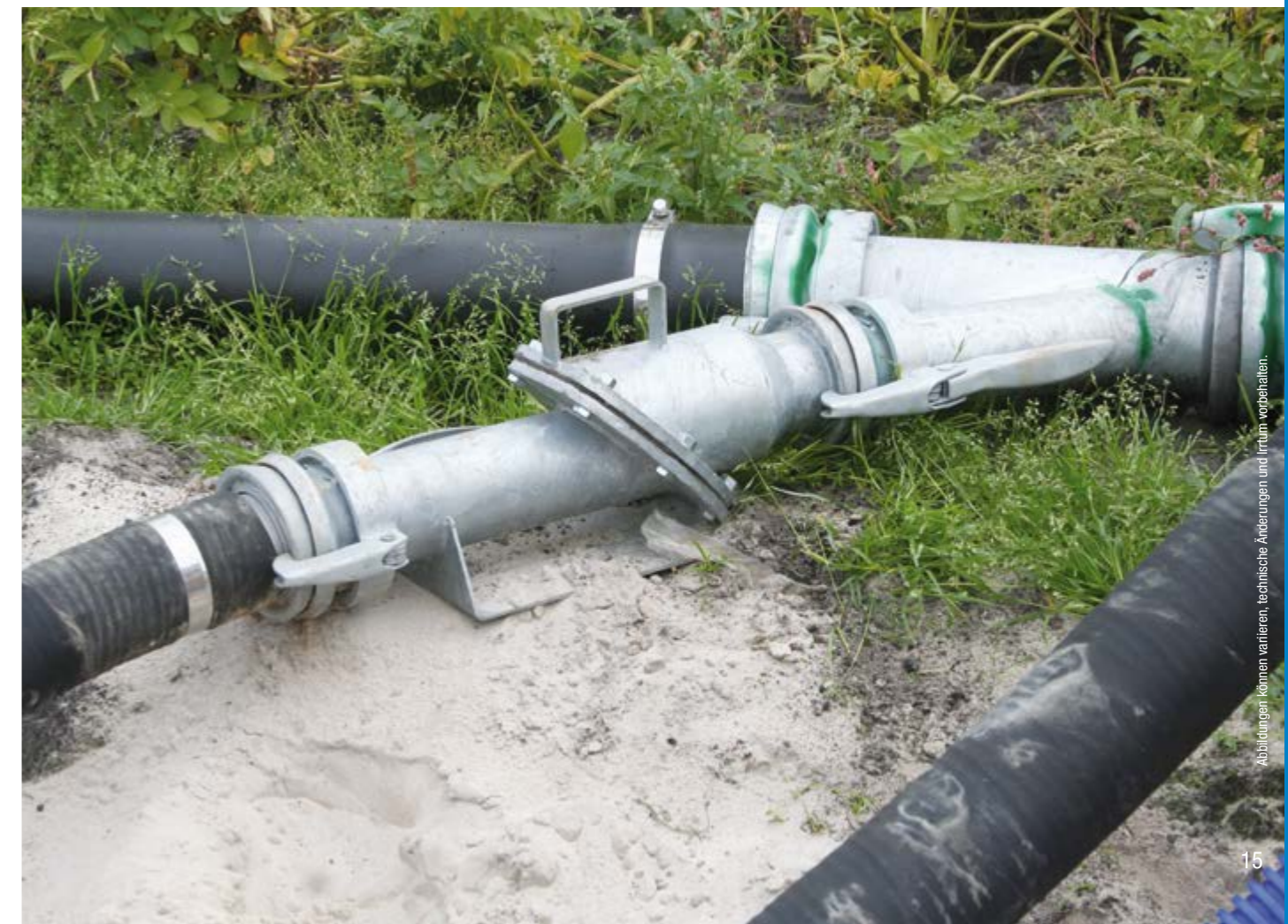
Abbildungen können variieren, technische Änderungen und Irrtum vorbehalten.